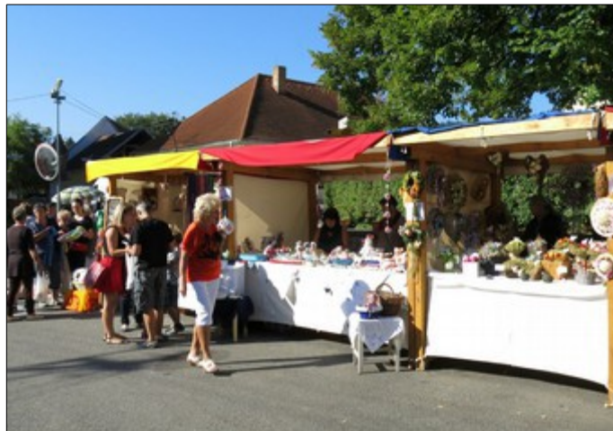
jarmark na náměstí