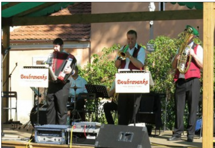
z vystoupení Doubřavanky