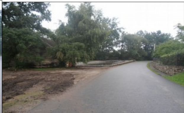
zrekonstruovaný rybník v Dolních Chráštanech