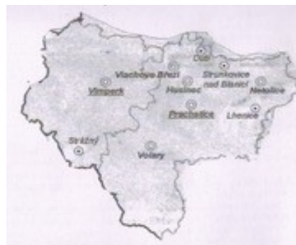
Na mapce města a městyse na Prachaticku