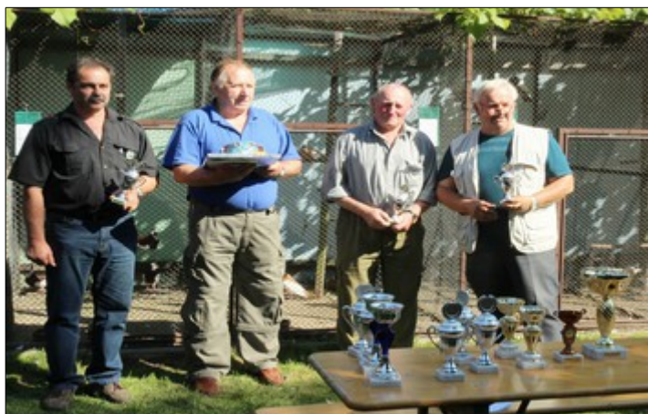
vítězní členové ČSCH