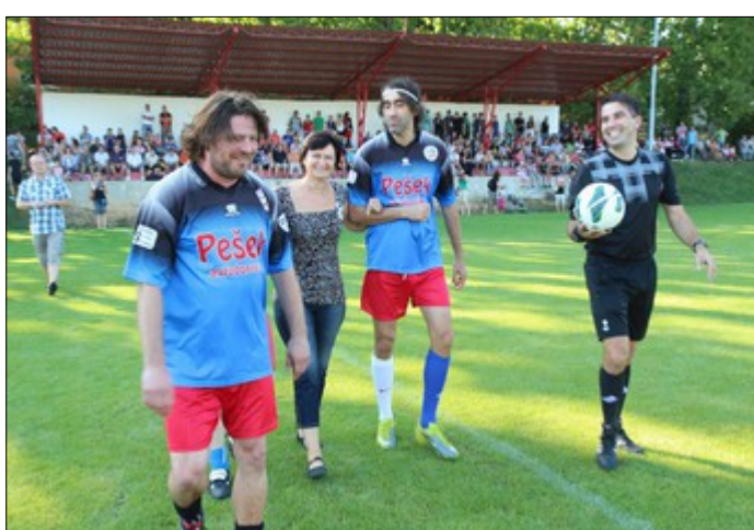
z utkání na hřišti SK – čestný výkop starostky