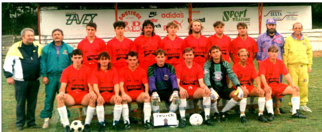
SK Lhenice – nováček I.A třídy – sout.roč. 1993/94