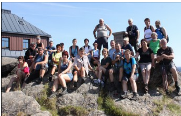
Foto: z týdenního zájezdu „Krušné hory 2013“ (10. - 17.8.)