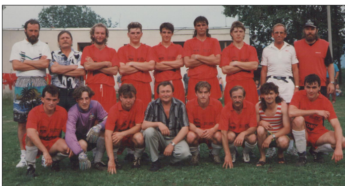
Týmy SK, co vybojovaly dva suverénní postupy do I.A třídy: Vlevo – šampión I.B tř.sk.B – sout.roč. 1992/93

90.léta přinesla i další významné události pro klub. V roce 1994 došlo k fúzi Tatranu Dol.Chrástřany s TJ Sokolem Lhenice a lhenické "béčko" pak převzalo účast v OP od Chrástřanských a klub pak hřiště na chrástřanském Hýblu. Rok 1998 se pak zapsal do lhenické historie rozpadem TJ Sokola Lhenice a osamostatněním oddílu kopané ve znovuzrozeném SK Lhenice, s návratem ke lhenickým fotbalovým tradicím se vším všudy, sahajícím až do roku 1933!