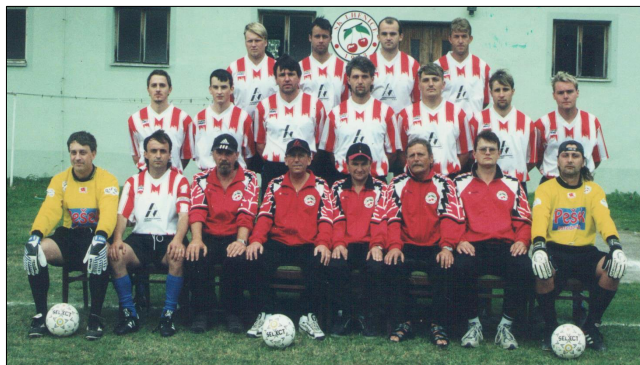
Vpravo - šampión I.B tř. sk.B – sout.roč. 1999/2000