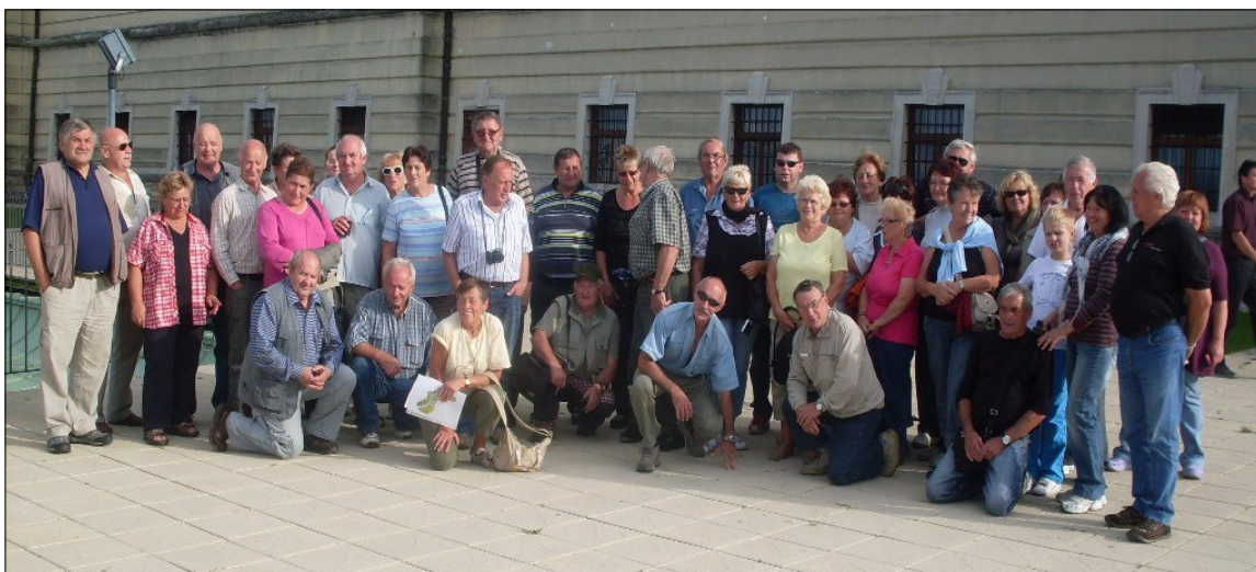
Foto: účastníci zájezdu pořádaného OS GRÁTIS (10.9.2013)