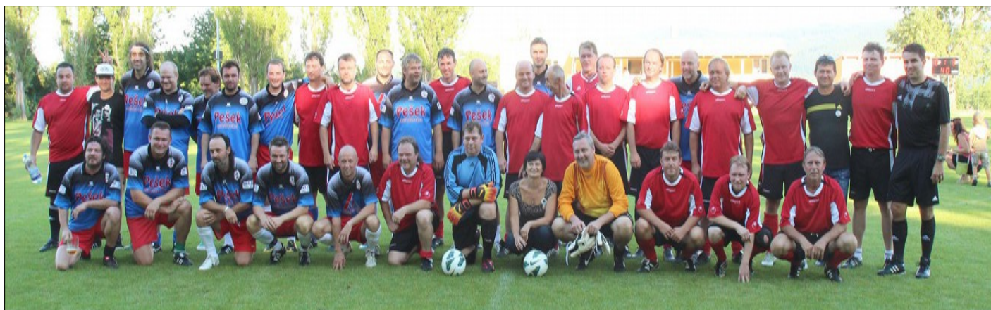
společné foto obou týmů