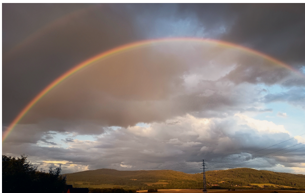
Letní nebe nad Lhenickem

Z OBSAHU: Informace z úřadu | Společenská kronika | Z našich škol | Historie | Z našich spolků a organizací | Kultura | Sport | Inzerce