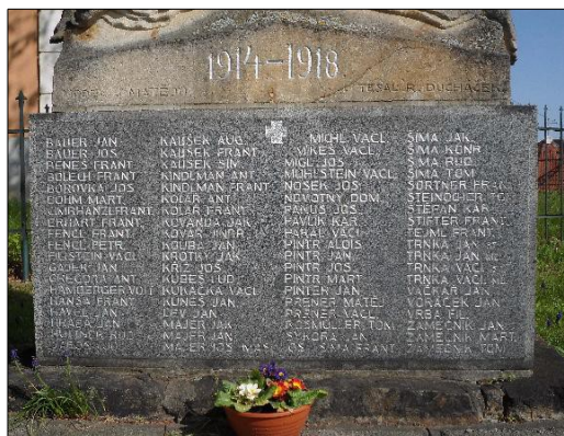
Foto: pomník padlých v 1.světové válce na lhenickém náměstí – vpravo detail jmen na pomníku