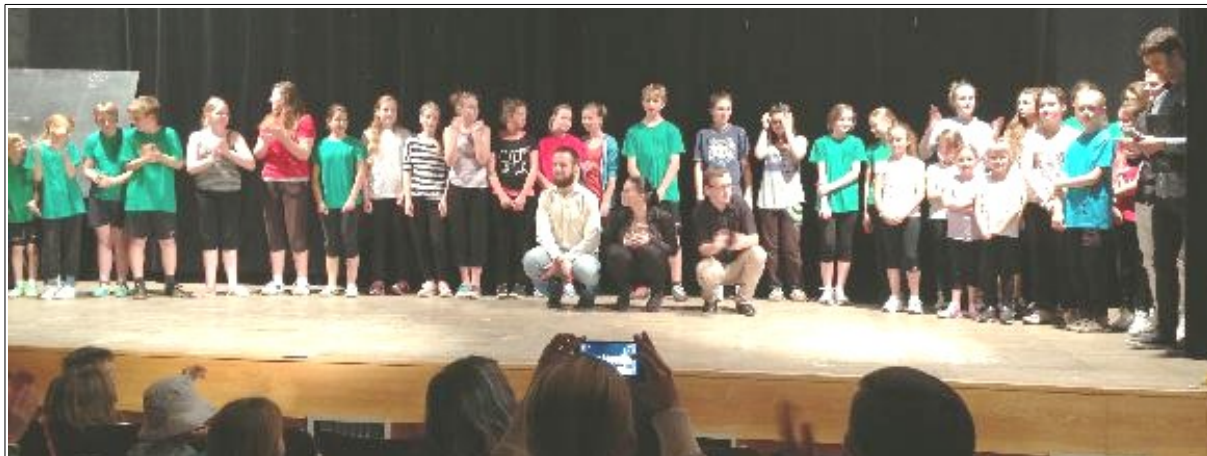
-z oslav 40 let nové lhenické školy (23.-24.5) - „děkovačka“ při škol. akademii „Dobří holubi se vracejí“ - ve lh. kině.