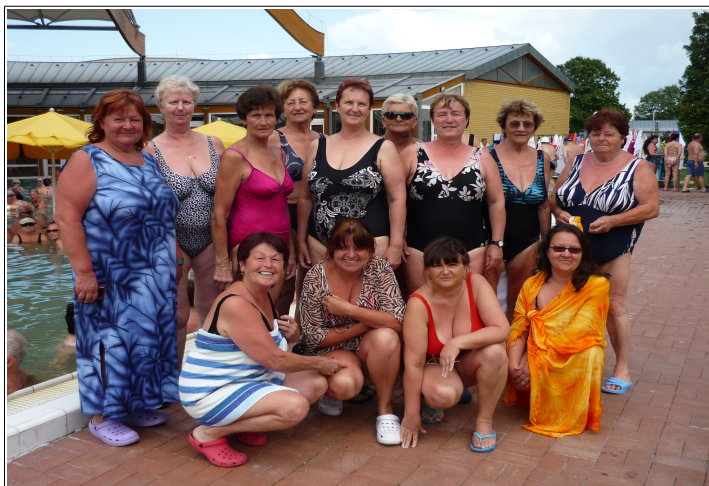
- společné foto lhenických žen v maďarských lázních