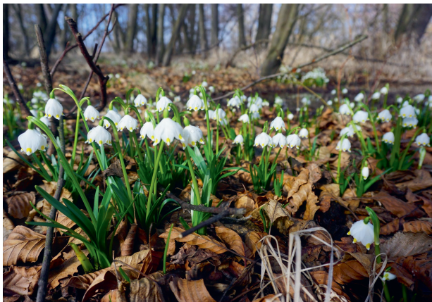
Bledule u Koubovského rybníka