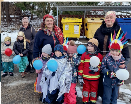
Broučci na masopustu v Jámě