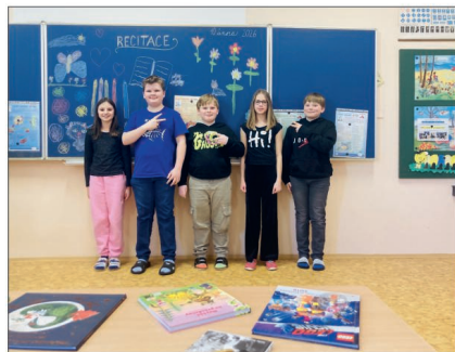
Recitační soutěž - školní kolo