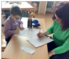
Zápis do 1. třídy