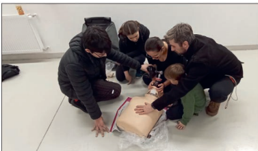
Stáž ve Netolicích