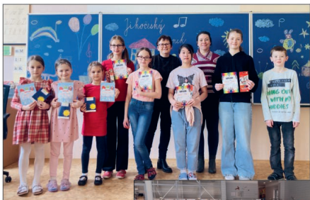
Jihočeský zvoněk - školní kolo