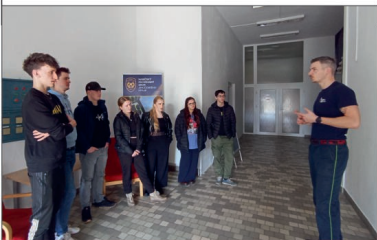
Exkurze ve Strakonících

Dne 15.2. mladší dorost absolvoval výcvik s dýchacími přístroji (viz. fotografie), přijela se podívat i delegace z Netolic, která si vyzkoušela vyváděcí masku. Dne 22.2. starší dorost s jednotkou z Netolic absolvovali výcvik s dýchacími přístroji, přišel se podívat i mladší dorost.