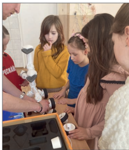
Projektové dny s roboty