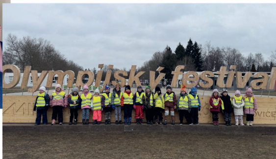
Žabky na Olympijském festivalu v Českých Budějovicích