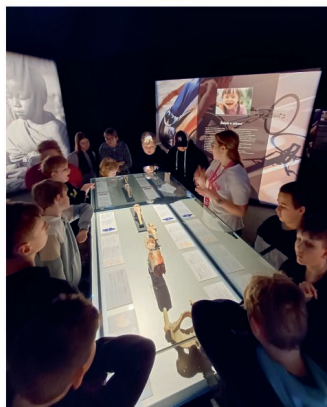
Badatelská výprava za poznáním - žáci z různých tříd