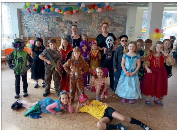
Školní karneval (ŠD)