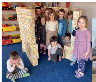
Rybíčky v centru Kostky