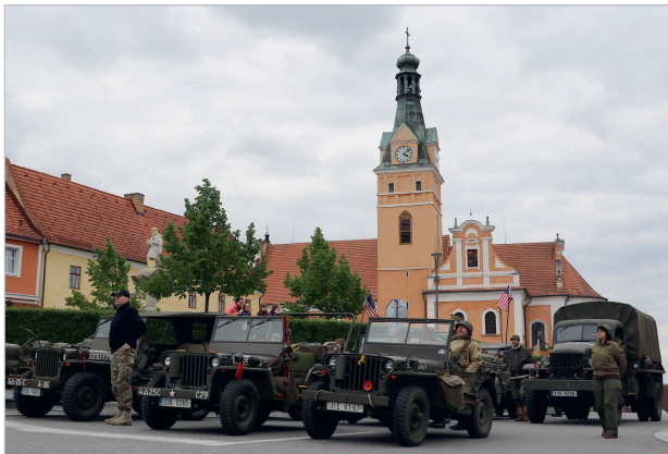
Vzpomínková jízda k 80. výročí osvobození Jihozápadních Čech

Z OBSAHU: Informace z úřadu | Z jednání zastupitelstva | Z našich škol | Historie | Z našich spolků a organizací | Klub seniorů | Sport | Kultura | Inzerce