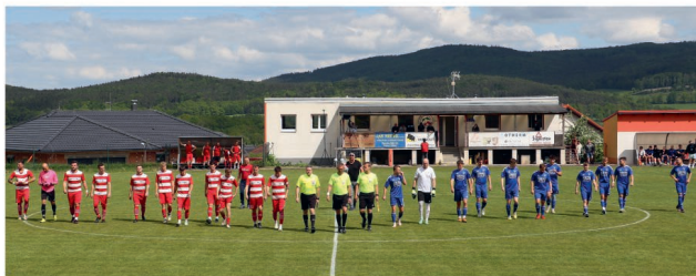
Ze zápasu s TJ Šumavan Vimperk