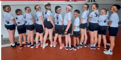
Teamshow na soutěži Mini CUP 2025