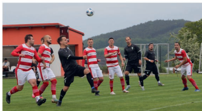
Ze zápasu s FK Vodňany

Zápas samotný oko diváka asi moc nepotěšil, my jsme sice dvakrát vedli a utkáni by se za normálních okolností dalo zřejmě i vyhrát, ale nejsme momentálně v takovém rozpoložení, abychom toho byli schopni. A nutno říct, že pro domácí by to bylo kruté. Oba týmy udělaly mnoho chyb a vyrobily spoustu nepřesností, diváci viděli množství technických nedostatků, dělba bodů je asi nakonec spravedlivá, my jsme nějaké šance měli, domácí také, dvakrát se nám oťel míč o břevno, naopak jsme nedotáhli z výše uvedených důvodů několik nadějných situací na útočné polovině v závěru utkání. Chtěl bych věřit, že v posledním domácím zápase s Katovicemi se představíme v lepším světle.