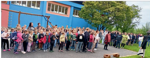
Nácvik požárního poplachu