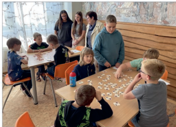
Turnaj v pexesu