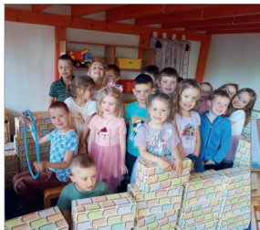
Rybičky v CA kostky téma „Dopravní prostředky“