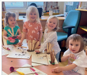
Motýlci si v tématu „Život na louce“ modelovali zvířátka, kytičky a broučky