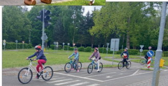
Výukový program (dopravní hřiště Prachatice) - 4. třída