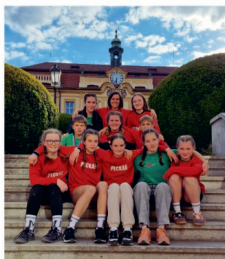
MČR Juniorů v Praze - Libni