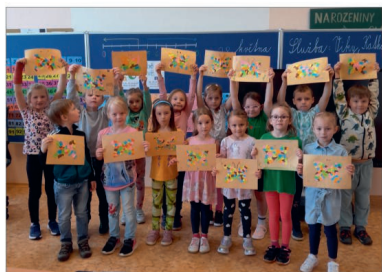
Edukativní odpoledne pro předškoláky