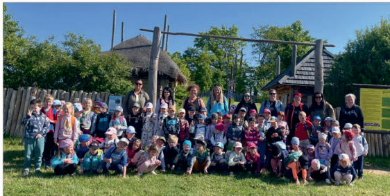
Výlet do Zeměraje