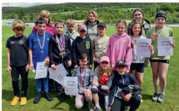
Sportovní olympiáda 1. stupně