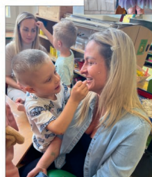
Den maminek ve školce