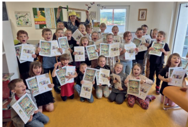
Pasování prvňáčků na čtenáře ve lhenické knihovně