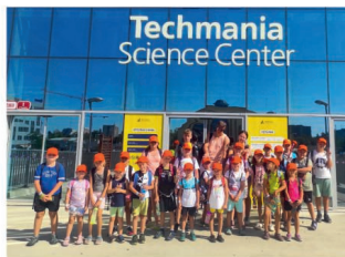
Příměstský tábor Lhenice, srpnový turnus - Techmania Plzeň