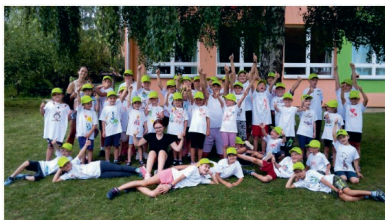
Příměstský tábor Lhenice, červencový turnus