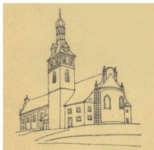
Obr. 4: Třetí varianta