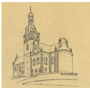
Obr. 3: Druhá varianta