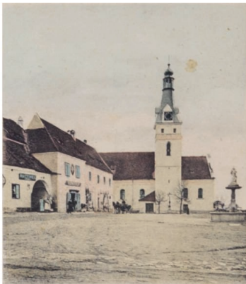
Obr. 1: Lhenický kostel na pohlednici z přelomu 19. a 20. století

Faráře Pužeje stály tyto dohady mnoho nervů. V jednom dopise zasláném na českobudějovické biskupství si posteskl, že je „známo, že dostačít k tomu jediný člověk, aby celou obec pobouřil, tak podnět k žádosti o třetího kněze ve Lhenicích zavalil pouze jeden občan, ten přemluvil jiné, kteří pak vzrušili celou farní osadu“. Několik místních se pokusilo sabotovat jednání i v den komisionálního šetření 17. srpna 1900, během něhož se na místě rozhodovalo o způsobu rozšíření kostela. Pužejev návrh na přístavbu nové sakristie a prodloužení presbytáře odmítli, a naopak se domáhali prodloužení kostelní lodi směrem na západ.