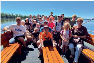
Zašifrovaný tábor na plavbě po rybníku Svět