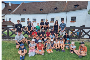
Zašifrovaný tábor v Nových Hradech