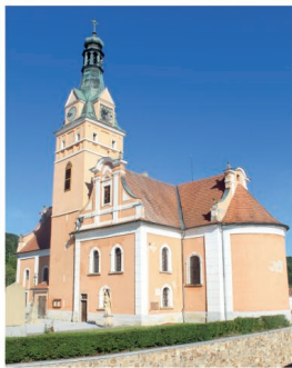
Obr. 5: Aktuální podoba lhenického kostela