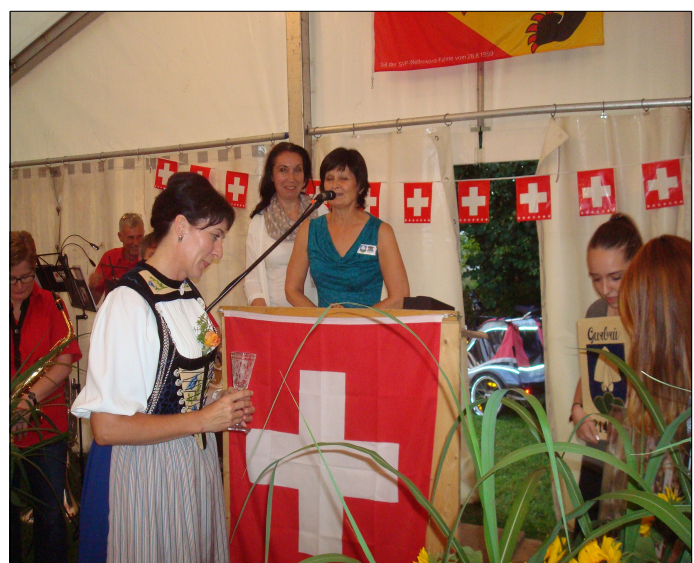
fota z pobytu v Gurbrü