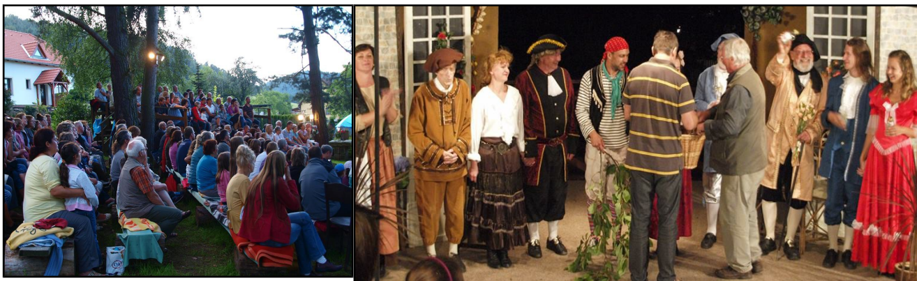
Foto: plné hlediště letního divadla v zahradě u Štěrbů se letos bavilo při představení „Sluha dvou pánů“

Čerpáno z publikace „100 let SDH ve Vadkově“ (rok vydání 2010), archivu netolických divadelníků a jiných zdrojů. JB, JM