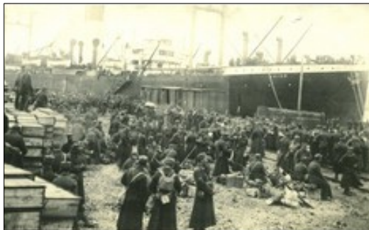
ilustr. foto vlevo: nalodování čs. legionářů ve vladivostockém přístavu