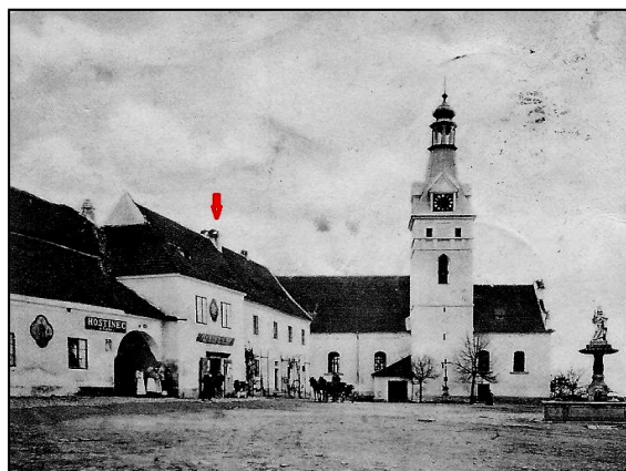
Lhenice roku 1903 – šipkou označen dům č.p. 2

Bylo by jistě zajímavé vědět, kdy byl poklad mincí v domě č. 2 uložen. Zpravidla se přibližná doba uložení určuje podle nejmladší mince v nálezě, tedy mince, na které je vyražen nejvyšší letopočet. Jenže všechny mince byly tehdy rozprodány a tak už se nedá zjistit, v kterém roce byly raženy. Pravdou ale je, že podobně