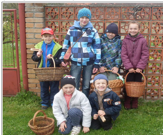
- pekání vajec na lhenickém náměstí na Boží hod velikonoční - vodičtí malí koledníci o Bílé sobotě