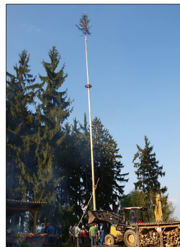
Foto – zdobení májky, opékání prasátka a postavení májky dobově za pomoci těžké techniky.... JB, JM