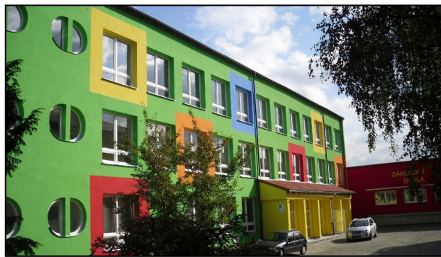
Foto vlevo: základní škola po otevření v r.1974 – vpravo: ZŠ v současnosti , v r.2014

Po dvacetiletí na něho působícího „zubu času“ a za nutnosti modernizace k náročným potřebám doby počalo již docházet k průběžným nutným větším úpravám jeho exteriéru i interiéru. Na první pohled nejviditelnější stalo se sedlové přestřešení pavilónů i spojovacích chodeb (od roku 1993 po etapách) a jejich přeměna v „barevnou školu“ při zateplení a pokrytí stěn pestře barevnými fasádami (v roce 2009). K přehlédnutí určitě není ani víceúčelové hřiště (slavnostně otevřeno 8.10.2011) zbudováno v rámci akce výstavby „Oranžových hřišť“. K viditelně velkému stavebnímu zásahu v interiéru pak došlo při přestavbě suterénu (uhelny) na učebny dílen, když po nich uvolněné prostory (v pavilónu bývalé „školičky“) umožnily v tato místa přemístění místní „zušky“ z budovy „U Vašků“ čp. 67 (slavnostně otevřeno 27.9.2012). Již v době předešlé (v roce 1991) také zde, ve školním areálu, v 1.patře pavilónu školní jídelny, našla „azyl“ mateřská škola (z ekonomických úsporných důvodů sem přemístěna zřizovatelem – obcí z nové pavilónové MŠ náročné na provoz a údržbu) a to za potřebných k tomu úprav, aby tady též vznikly pro „mateřinku“ zahrady „stanožek“ č.1 a č.2 s herními prvky (slavnostně otevřeny 27.10.2007 a v září 2011).