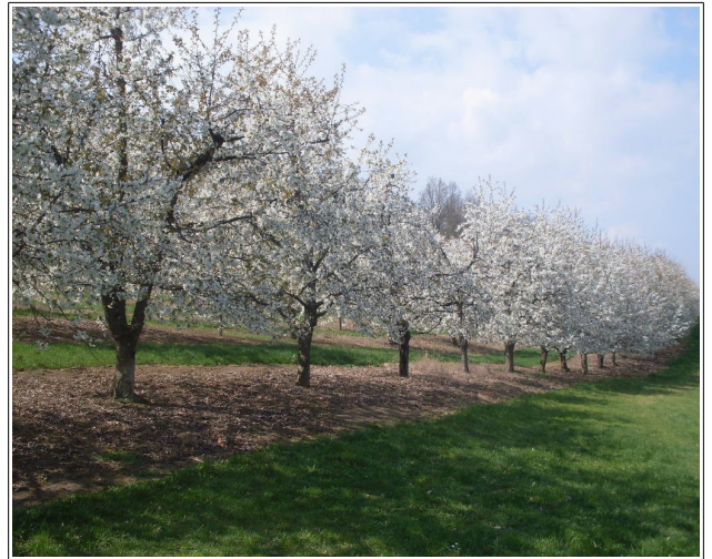
Foto: „Grátis“ o.s - sdružení aktivních důchodců opět po roce v květech v třešňových alejích, které letos rozkvetly velice brzy - 7.4. 2014.