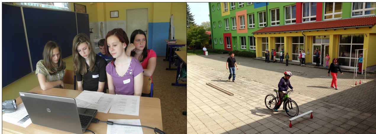
Vlevo: „Úsměvy na dálku“ po internetu v angličtině 7.4. – vpravo: ze dne dopravní výchovy na škole 24.4.