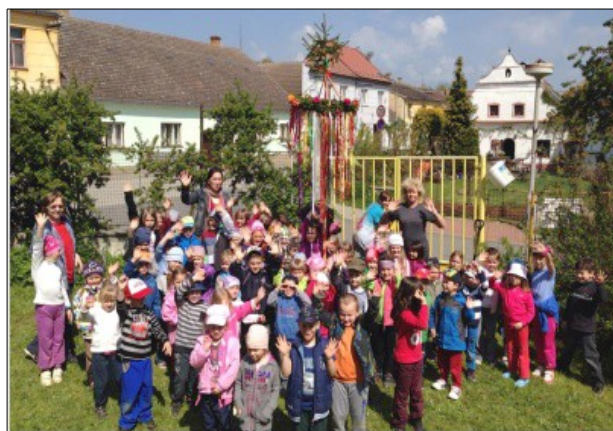
Foto vpravo – Jak děti z MŠ stavěly májku 30.4.2014