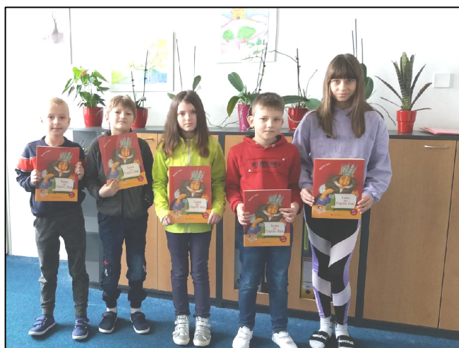
Foto vlevo – laboratorní práce z chemie - 9.třída; vpravo – pohádky pro ukrajinské děti