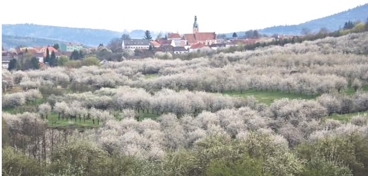
Naše Lhenicko opět rozkvetlo do krásy – více uvnitř listu