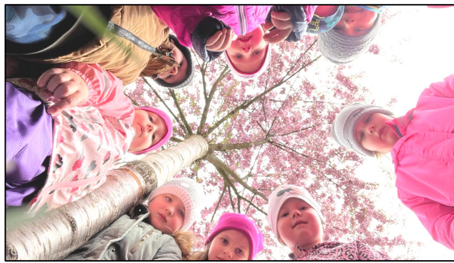
Foto vlevo – třída Motýlků zdobí velikonoční kraslicovník na náměstí; uprostřed – čarodějnický ples; vpravo – rozkvetlé jaro s třídou Žabek