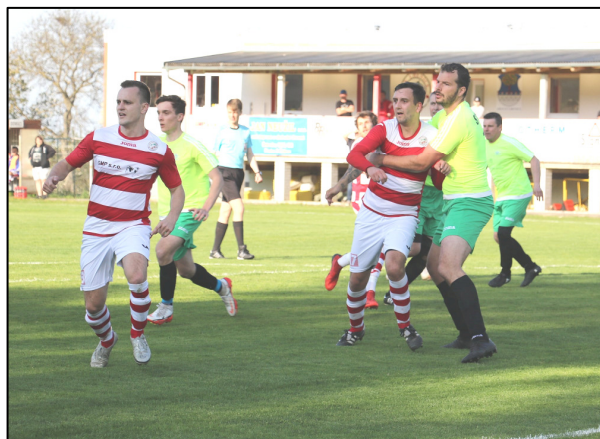
Fota: vlevo – z opožděné domácí premiéry s prachatickým Tatranem C – 2:1 (23.4.); vpravo – z domácí dohávky se Sokolem Stachy 4:0 (4.5.)