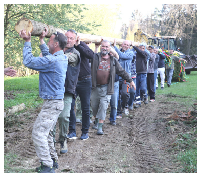
Foto – vlevo „dvoják“ typický pro májku u Vejrovského rybníka, uprostřed májka na „staráku“ letos přizdobena patrioty vlajkou, vpravo nahoře – ke stavbě májky neodmyslitelně patří sele na rožni, dole statní chlapi staví májku na starém hřišti v lese u hřbitova