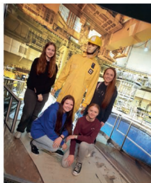
Exkurze do Temelína