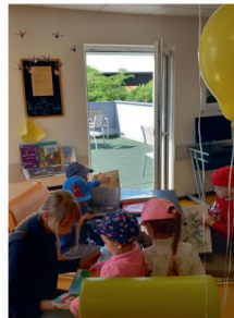
Motýlci ve lhenické knihovně