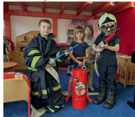
Rybičky a téma hasiči