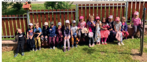
Broučci na zahradě