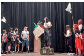
Vystoupení 6. A. na akademii