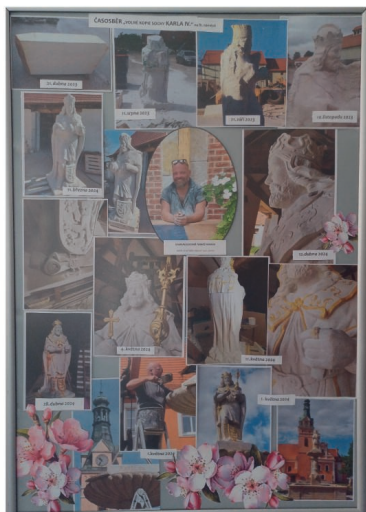
Časoběr vzniku volné kopie sochy Karla IV.