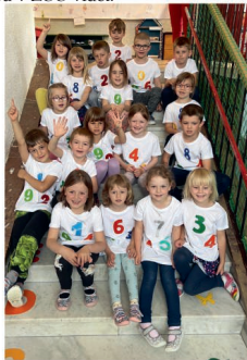
Předškoláci se těší na vystoupení