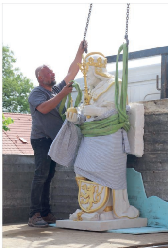
Převoz sochy 1.5.2024