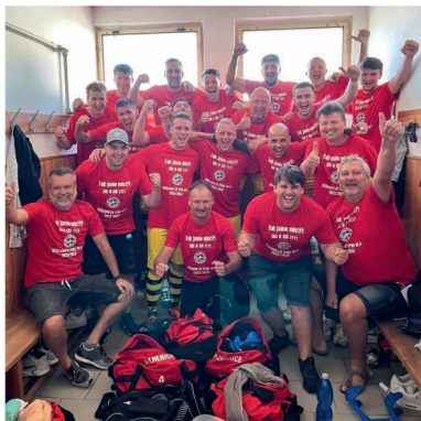
SK Lhenice je Mistrem 1.B třídy, sk. A v sezóně 2023/2024 !