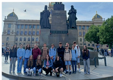
Výlet 9. tř. do Prahy