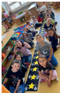
Žabky jsou Superstar