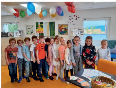
Pasování prvňáčků na čtenáře 28.5.