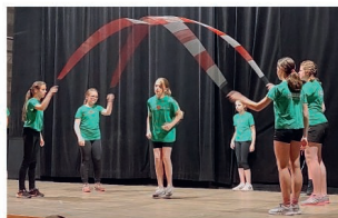
Vystoupení kroužku Rope skippingu na akademii