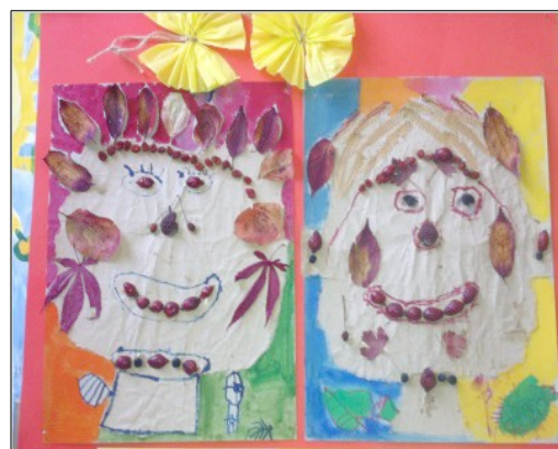
Podzimní výtvarné práce dětí z MŠ